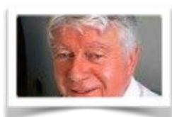
L'EDITO DU PRESIDENT