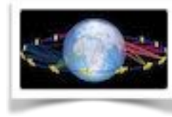
LE COIN DE LA TECHNO