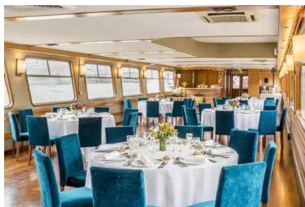
puis la salle de restaurant

et pour terminer, la croisière sur la Seine !