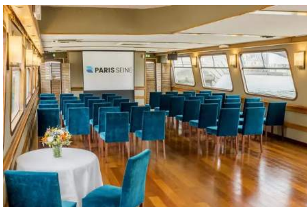
d'abord la salle de réunion

D'ASSISTER A NOTRE ASSEMBLÉE GÉNÉRALE AVEC PARIS EN TOILE DE FOND