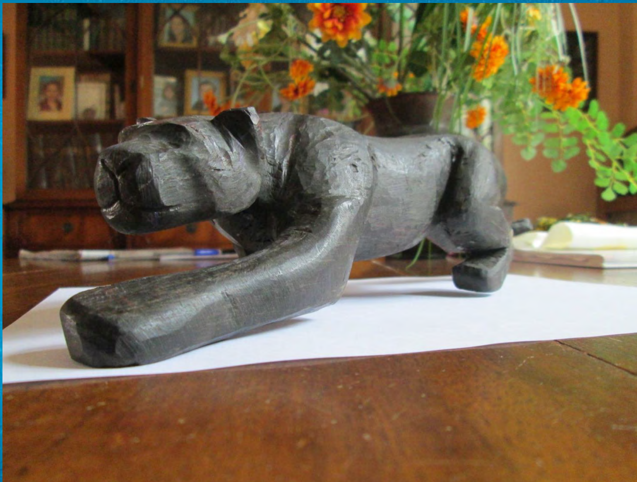
PANTHÈRE NOIRE (ébène)