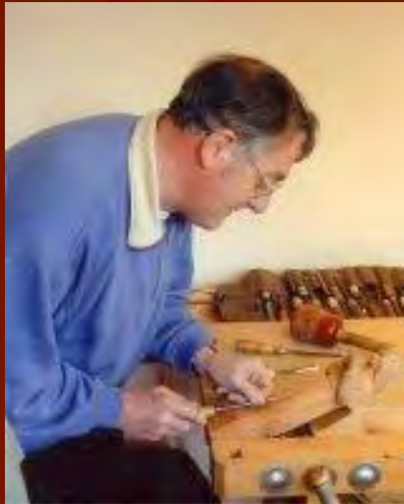
Le maître en son atelier