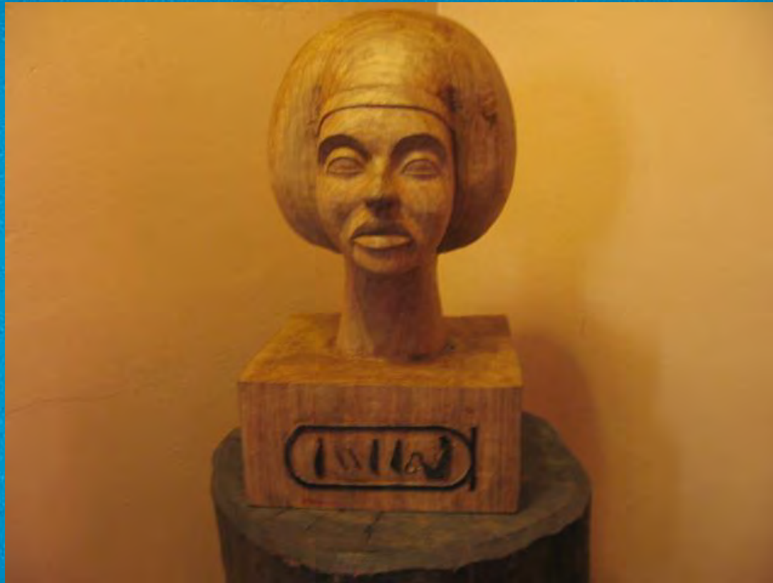
La reine TYI, mère d'Akhenaton et grand-mère de Toutankhamon