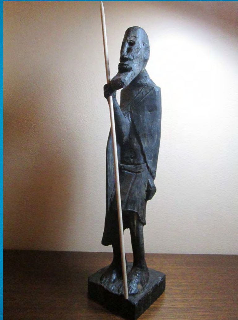
un berger Masai (2016)