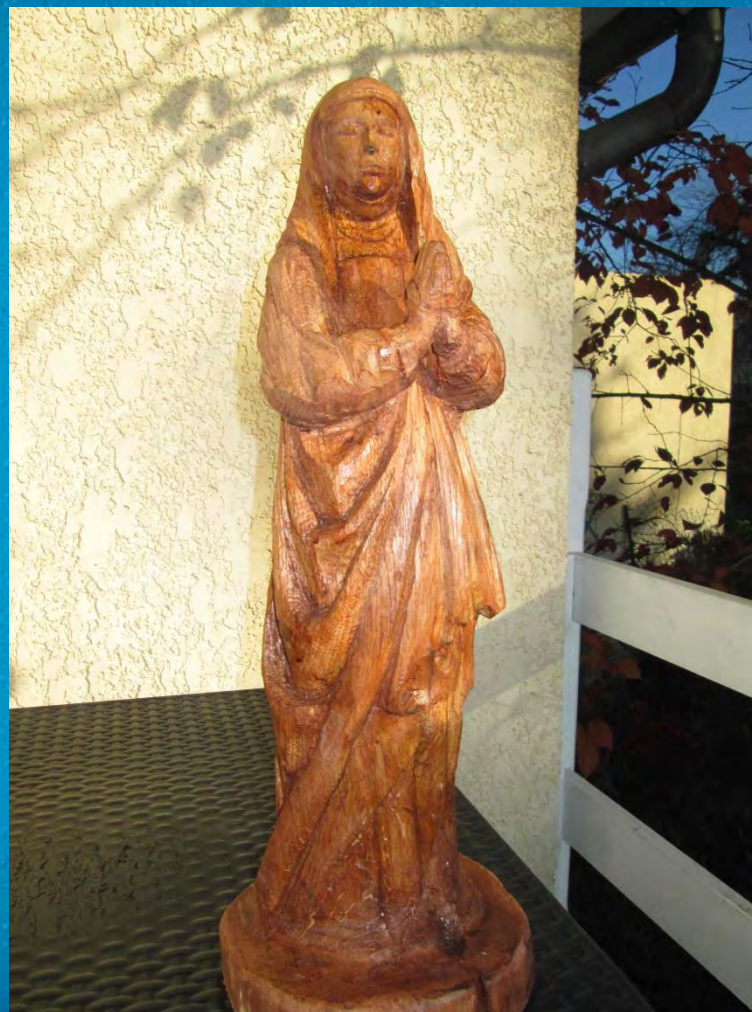
Sainte Catherine d'Alexandrie (chêne 30 cm, 2015)