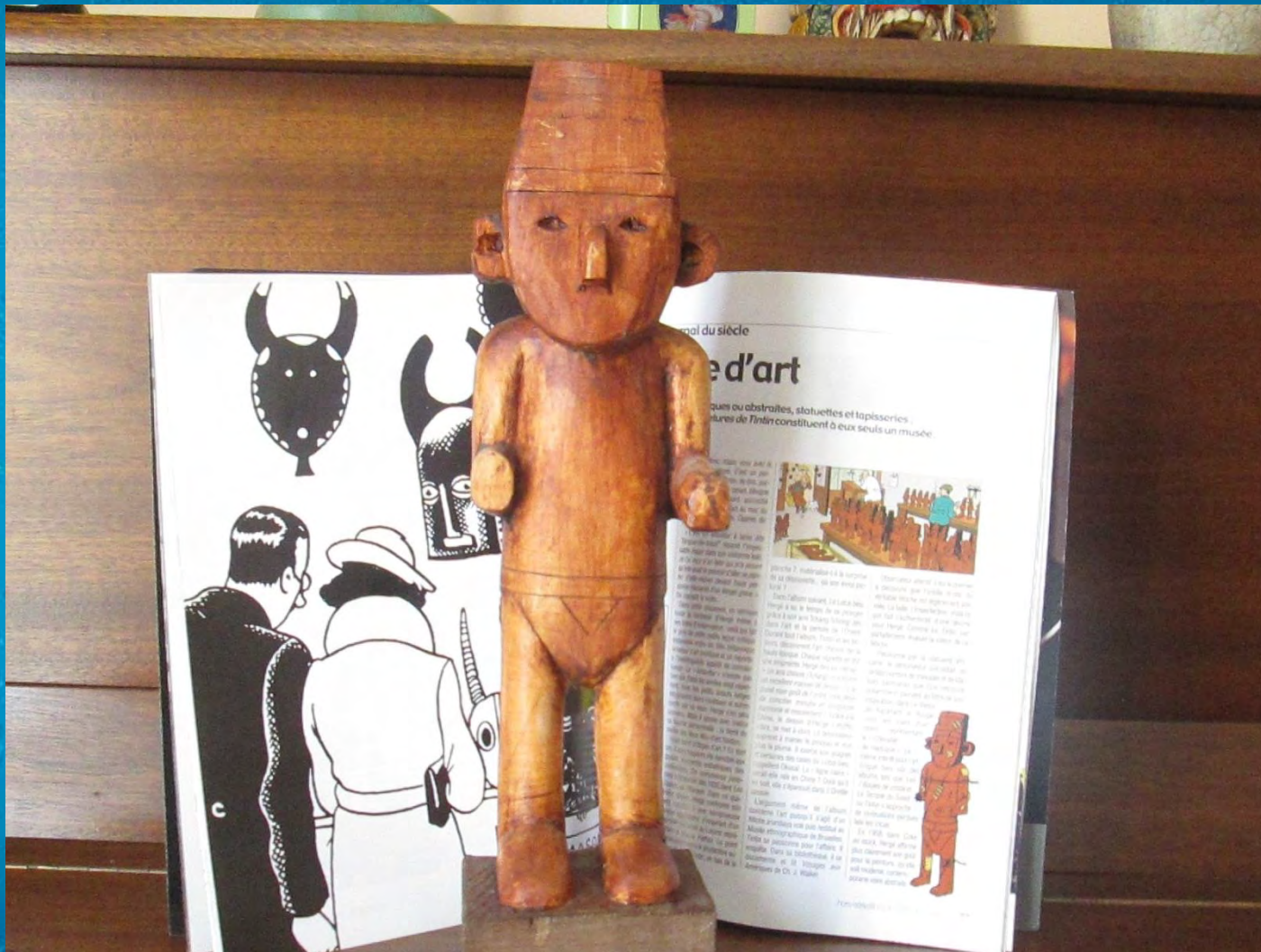
Idole dans « TINTIN , L'oreille cassée » (tilleul coloré chêne, 2017)