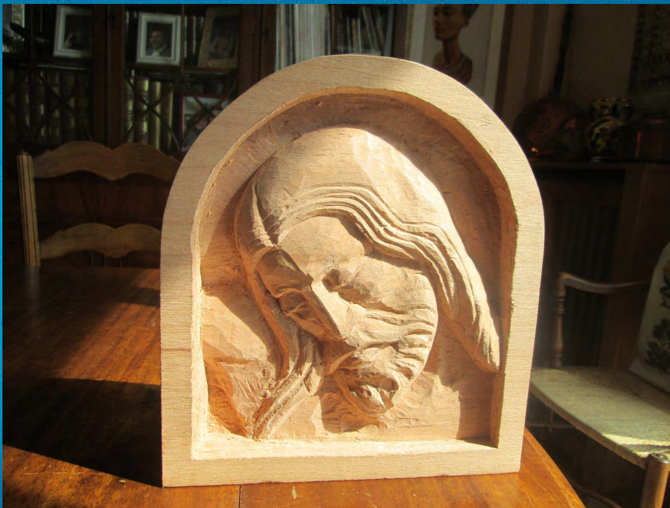
Tête de Christ en bas-relief, d'après le crucifix de la cathédrale de Biarritz (2018)