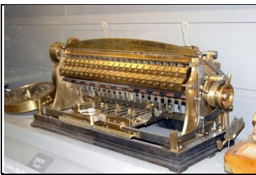
Multiplicatrice Bollée exposée et visible au CNAM à Paris

En 1885, à 14 ans, inventeur précoce, Léon Bollée se fait connaître par la construction d'une sorte de pédalo. En 1889, à 19 ans, pour venir en aide à son père fondeur de cloches, et éviter les erreurs dans les nombreux calculs que requiert leur fabrication, il invente et réalise une calculatrice mécanique révolutionnaire, de 3000 pièces, dite à multiplication directe, qui reçoit un premier prix à l'Exposition universelle de Paris de 1889.